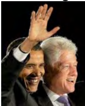
Obama og Clinton sammen på et valgmøte i Florida 29. oktober.

Vinca LaFleur ser mange likheter mellom sin tidligere arbeidsgiver i Det hvite hus og Barack Obama.