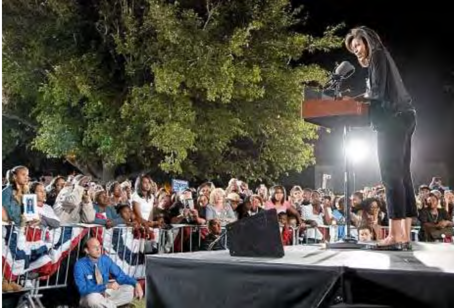
Michelle Obama skaper stor entusiasme på sine valgarrangementer. Her holder hun en tale i Las Vegas 27. oktober.